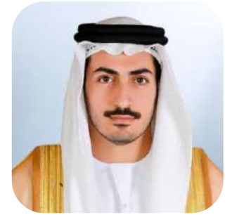
سمو الشيخ محمد بن سلطان بن خليفة آل نهيان رئيس مجلس الإدارة

صاحب السمو الشيخ محمد بن سلطان بن خليفة آل نهيان هو قيادي على مستوى مجالس الإدارة وصنع القرار المؤسسي، يتمتع بخبرة واسعة في الإشراف الاستراتيجي على مجموعات أعمال متنوعة ومنظمات متعددة القطاعات. ويُعرف بدوره في توفير التوجيه الاستراتيجي طويل الأمد، وتعزيز الأطر المؤسسية المنظمة، وممارسة إشراف فعال ومنهجي على أعمال مجالس الإدارة عبر نطاق واسع من القطاعات، تشمل التجزئة، والصناعة، والعقارات، والطيران، والقطاعات المرتبطة بالطاقة، وتقنيات البيئة، والتكنولوجيا المالية، والضيافة، والقطاع الطبي، والأنشطة البحرية.