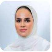
عضو مجلس الإدارة